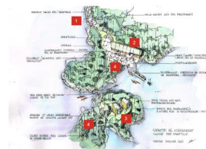
Figur 3: Skisse på utvikling av Kråkeneset med bryggjeanlegg, fellesanlegg med naust/foyerikale og hytter for overnatting