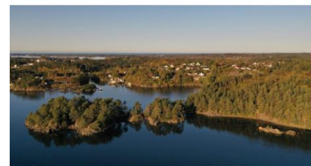
Billett 4: Kråkeneset ligg midt på Bømlo, i sjøve indrefløyen av turlagper og aktivitetsilbod.